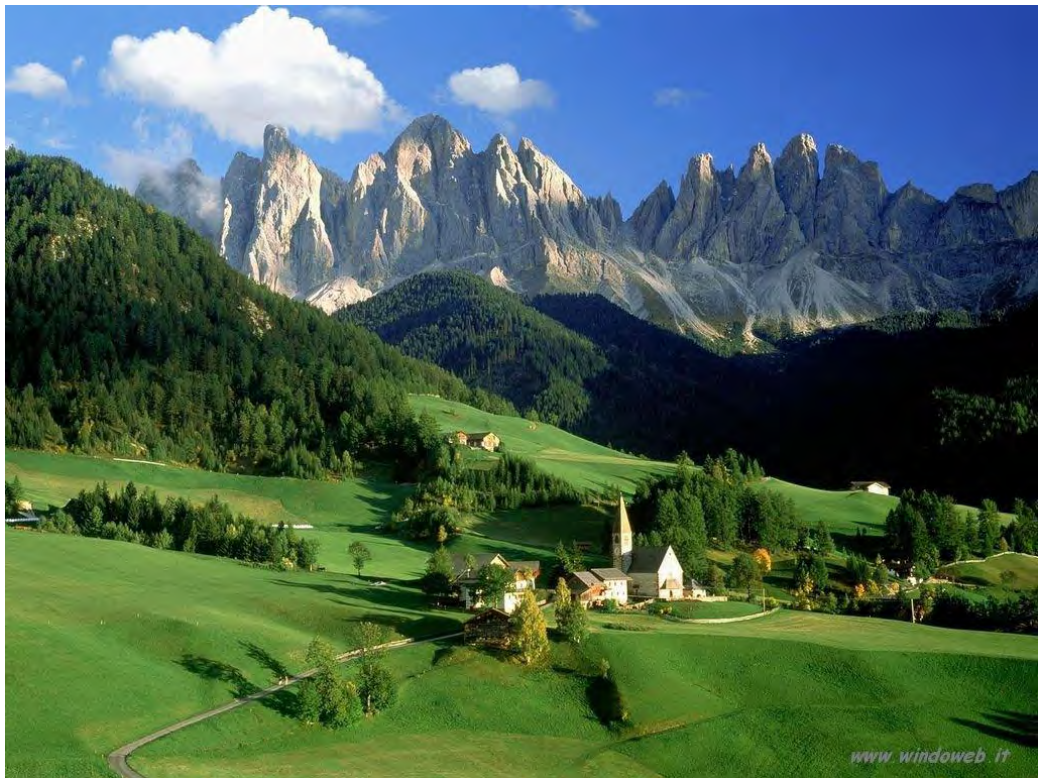
Funes e le Odle

Secondo la moderna accezione i beni ambientali fanno parte del patrimonio culturale di un paese, sono riconosciuti come zone corografiche, ossia rappresentative di una determinata regione, che costituiscono paesaggi naturali o trasformati ad opera dell'uomo (quelle zone in cui siano presenti strutture insediative urbane che, per il loro pregio, offrono testimonianza di civiltà). Ma non è sempre stato così. Nella legge 1° giugno 1939, n.1089 (Legge "Bottai"), a lungo restata il testo di riferimento per la tutela e la protezione dei beni culturali in Italia, si parlava infatti di "cose d'arte", comprendendo quindi solo beni significativi dal punto di vista estetico e solo beni costituiti da oggetti materiali. Parallelamente, nella legge n.1497 dello stesso anno, che riguardava la tutela ambientale, si parlava di "bellezze naturali", non elette ancora quindi a status di bene (o patrimonio). Secondo l'articolo 9 della Costituzione italiana, "la Repubblica promuove lo sviluppo della cultura e della ricerca scientifica e tecnica. Tutela e valorizza il patrimonio storico e artistico della nazione" . Solo nell'articolo 117, nelle competenze dello Stato e delle Regioni in materia di tutela e legislazione dei "beni culturali" , si afferma che è lo Stato che deve legiferare in tema di "tutela dell'ambiente, dell'ecosistema e dei beni culturali" .