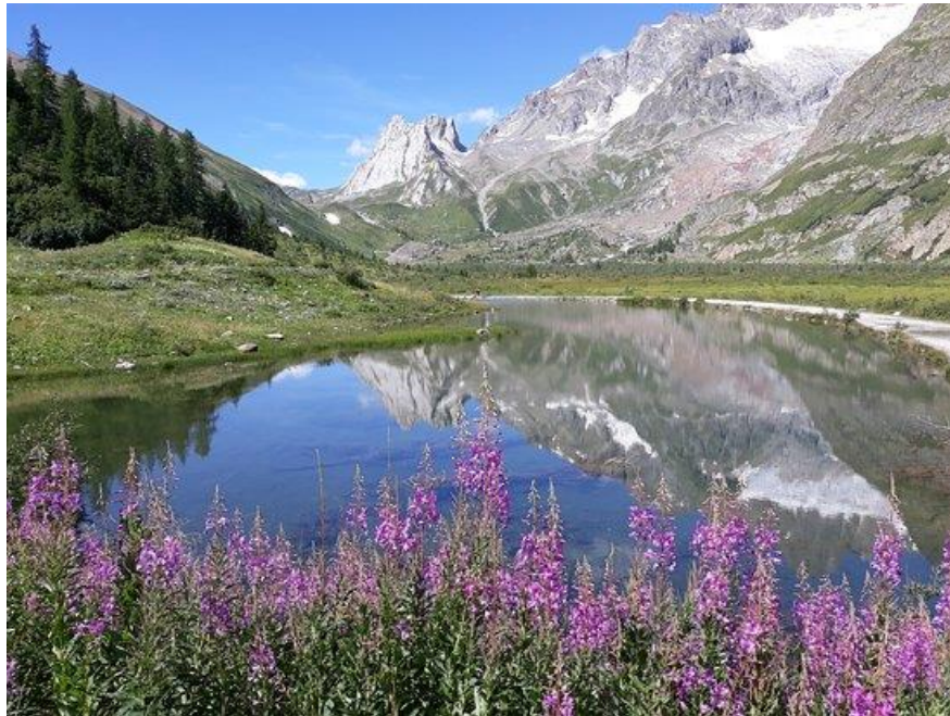
Lago Combal - Val Veny