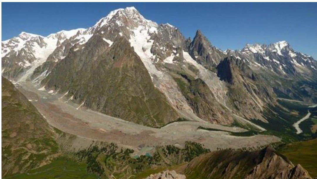
Ghiacciaio del Miage - Monte Bianco